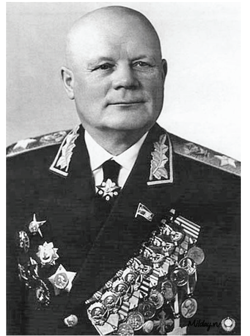
Филипп Иванович Голиков, в январе 1942 года командовал 10-й армией, освободившей п.Думиничи от фашистов.

Все боевые операции партизанского отряда «За Родину» имели скользящее действие на немецкие войска, не позволяли им в полной мере сосредоточиться для организации и проведения наступательных операций. Немецкая армия вынуждена была часть своих подразделений отвлекать на борьбу с партизанами, а постоянная борьба партизан с карателями и